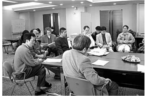
Fig. 2 The facilitators' meeting

次に診療ガイドラインと医師の職能としての自律性との関連性についての議論を振り返った。結論としては、Elliott A. Krauseの著作「Death of the guild」 24) を範に取り、医師の職能集団としての自律性は産業資本への傾性により規定される以上、ガイドラインを通じての職能の自律性の確立につ